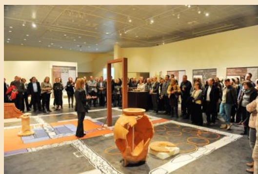
Εγκαίνια της έκθεσης «Κάστρο Καλλιθέας, Ματιές σε μια αρχαία πόλη»