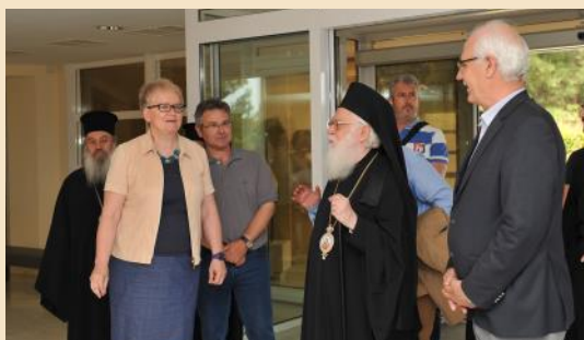
Από την επίσκεψη του σεβασμιωτάτου Μητροπολίτη Αλβανίας Αναστασίου