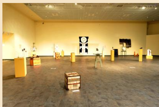
Ομαδική εικαστική έκθεση «Περὶ Υγείας»