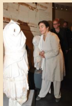
Από την ξενάγηση της Υπουργού Πολιτισμού κ. Α. Κονιόρδου