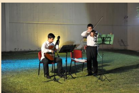
Στο φως του φεγγαριού, Πανσέληνος στο Διαχρονικό Μουσείο Λάρισας