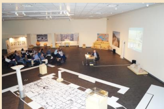
Διεθνής επιστημονική ημερίδα «Οχυρωμένοι οικισμοί της εποχής του Ιουστινιανού»