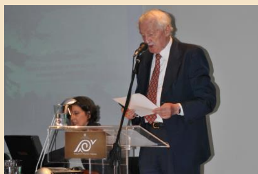
Διάλεξη του Γερμανού αρχαιολόγου Harald Hauertmann, καθηγητή του Πανεπιστημίου της Χαϊδελβέργης