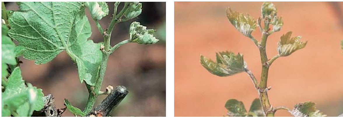
Νεαροί βλαστοί με έντονη προσβολή από ωίδιο ( Uncinula necator )

Για τον περιορισμό του αρχικού μολύσματος συστήνεται η συλλογή και η καταστροφή των προσβεβλημένων βλαστών. Αυτό το καλλιεργητικό μέτρο καλό είναι να εφαρμόζεται από τους αμπελουργούς μία φορά την εβδομάδα, αρχίζοντας δύο εβδομάδες μετά την έκπτυξη των οφθαλμών και μέχρι την άνθηση.