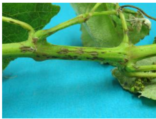
Χαρακτηριστικό σύμπτωμα των ασθενειών σε τρυφερή κληματίδα.

Η βροχή και οι σχετικά χαμηλές θερμοκρασίες συμβάλουν θετικά στην απελευθέρωση των πυκνιδιοσπορίων και στη μολυσματικότητα της ασθένειας.