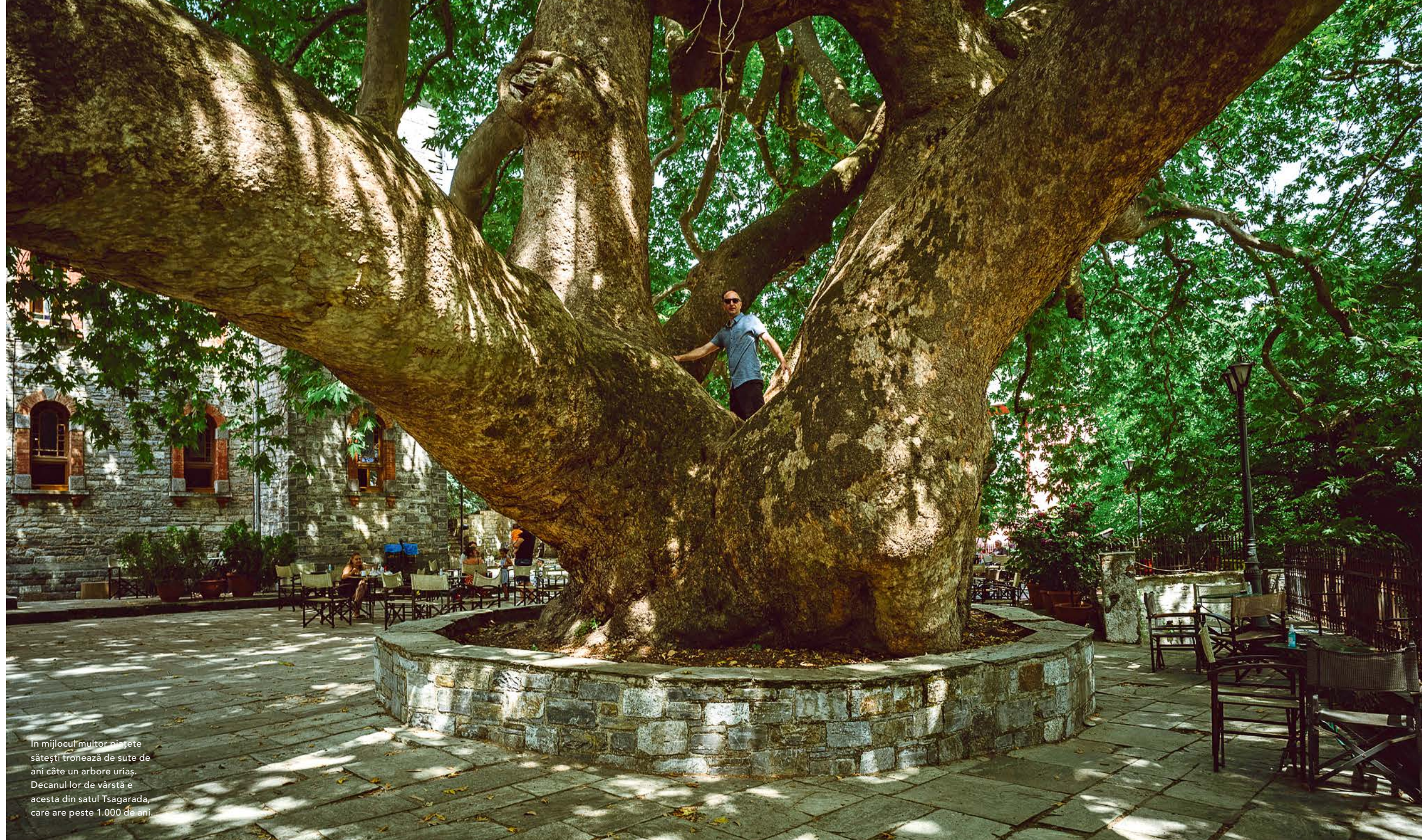
În mijlocul multor pietete sătești tronează de sute de ani câte un arbore uriaș. Decanul lor de vârstă e acesta din satul Tsagarada, care are peste 1.000 de ani.

www.kentrikonboutiquehotel.reserve-online.net/about