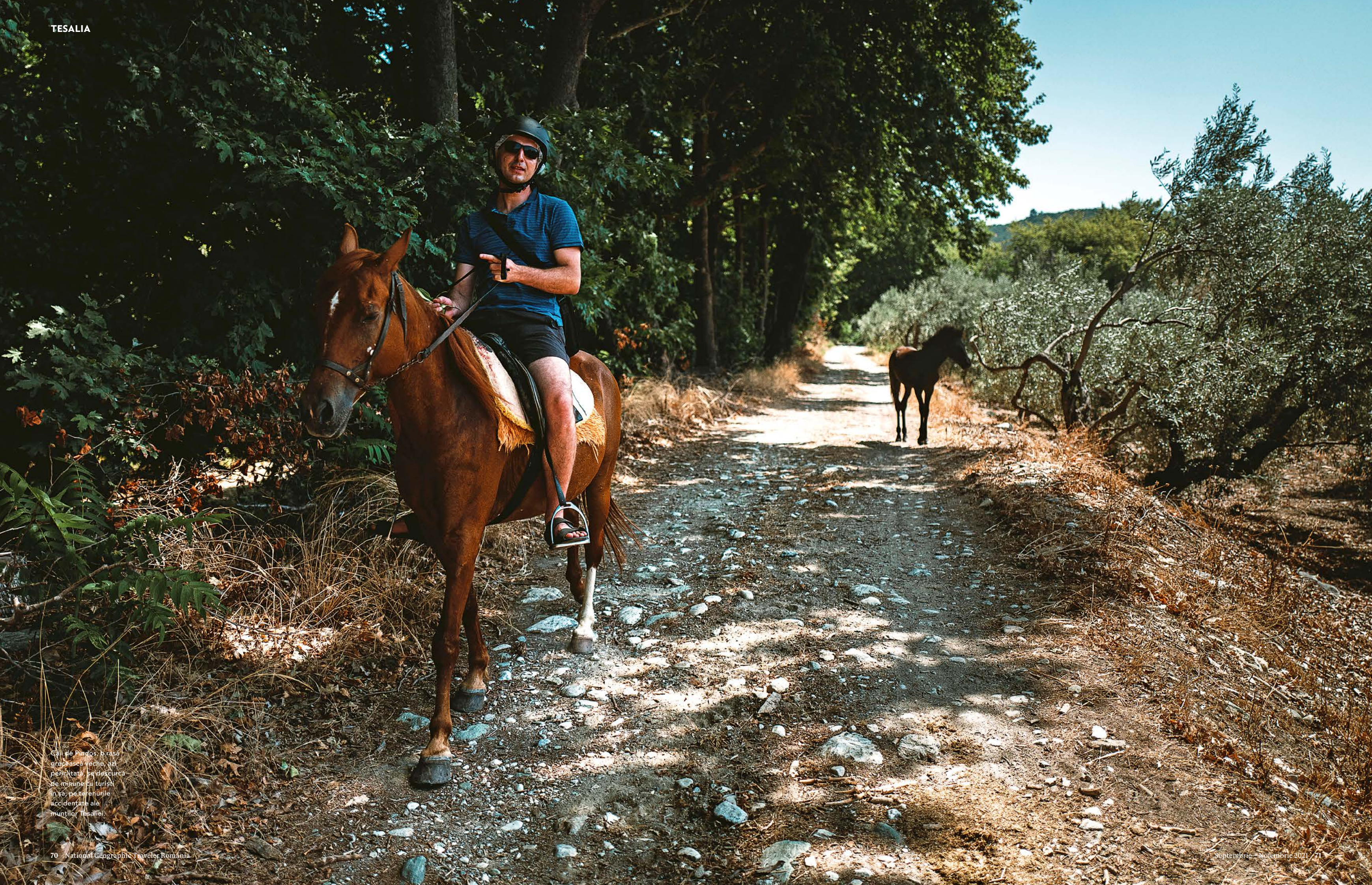
Căii de Pindos, o rasă grecească veche, au particularitate să dea cursul de mânăne cu turisti în să, pe terenurile accidentate ale munților Tesaliei.