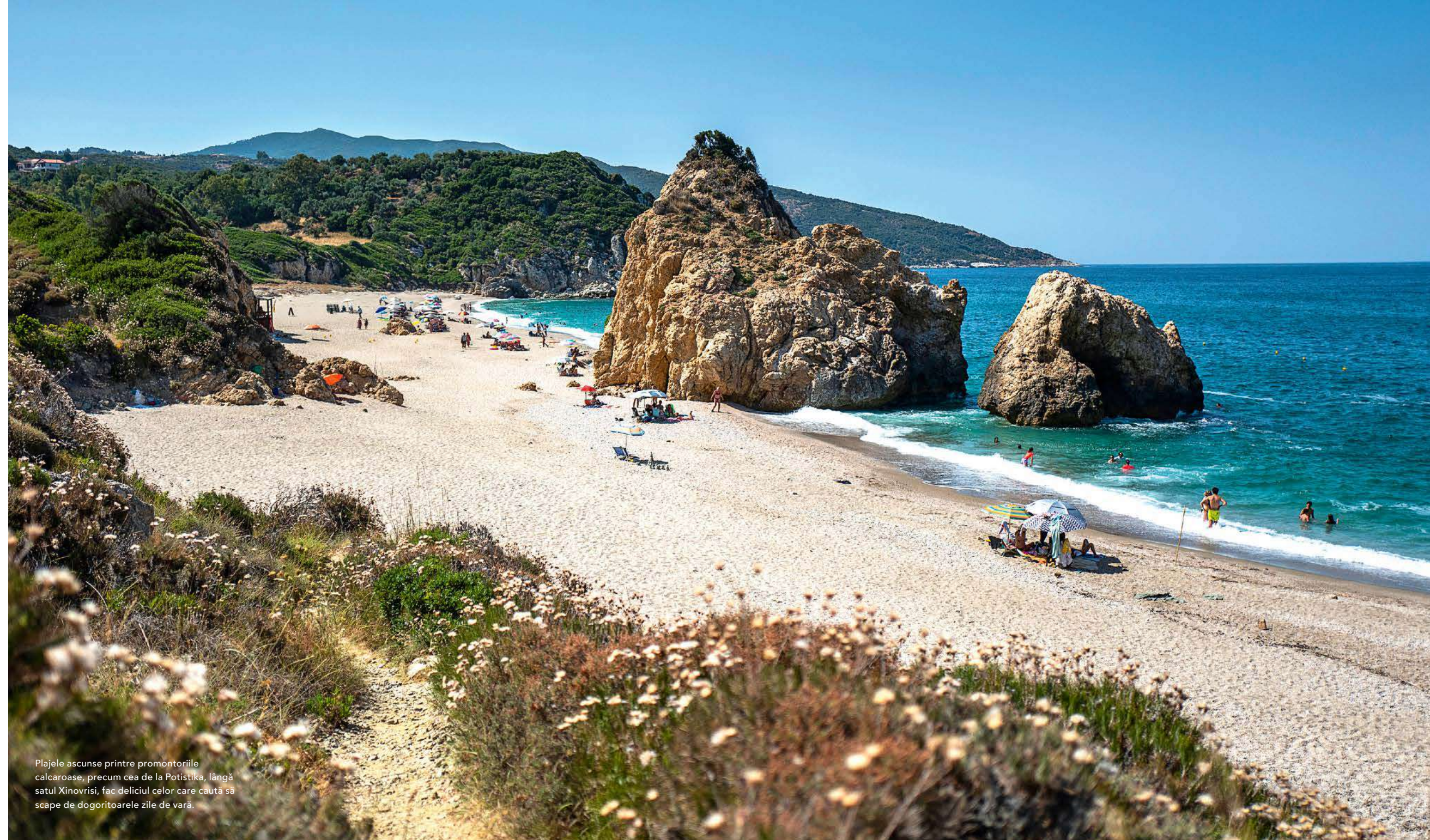
Plajele ascunse printre promontoriile calcaroase, precum cea de la Potistika, lângă satul Xinovrisi, fac deliciul celor care caută să scape de dogoritoarele zile de vară.

– Pe ecranul de pe cornul din stânga reglezi puterea, de la 1 la 5, cu care vrei să te ajute bicicleta, în funcție de pantă. Pe cornul din dreapta, sunt vitezele. Vă recomand să mergem pe 5 sau 6. Nu