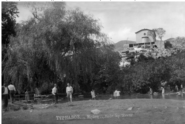
Φωτο: Η πηγές Αγ. Άννας (Βρύση) πριν των έργων υδρομάστευσης. Δεξιά των πηγών το «Βαένι»

Ο ίδιος μας πληροφορεί σχετικά για την παράλληλη λειτουργία του Δήμου Τυρνάβου και της παλιάς Κοινότητας Τυρνάβου: Μετά την προσάρτηση από του 1881 — 1912 εκ παραλλήλου προς την Δημαρχίαν ελειτούργησε και Κοινότης, ή όποια διεχειρίζετο όπως και η παλαιά τα έσοδα των εκκλησιών και του νεκροταφείου, διώριζε τους επιτρόπους και είχε τον έλεγχον της διαχειρίσεώς των. Οι σκοποί της ήσαν φιλανθρωπικοί, εις αυτήν δε οφείλονται και τα εξωραϊστικά έργα της πλησίον του Τυρνάβου Βρύσης, διάφοροι δρόμοι, και η δια δικαστικού αγώνος επανάκτησις των κτημάτων Προφήτου Ηλία και Αγ. ‘Αθανασίου, καθώς και η κατάρτισις και συντήρησις της τότε κοινοτικής βιβλιοθήκης. Το κοινοτικόν συμβούλιον εξελέγετο δια μυστικής ψηφοφορίας των κατοίκων Τυρνάβου. Κατά το 1912 έπαυσεν υφιστάμενη, όταν ο Δήμος υπεβιβάσθη εις Κοινότητα.