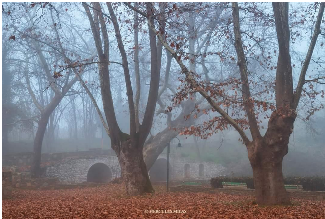
Φωτο: Η Αγία Άννα Τυρνάβου. Διακρίνονται οι θόλοι που χρησιμοποιούνταν ως κατάστημα. Τα πλατάνια είχαν φυτευθεί από το τέλος του 19 ου αι. Μια ακόμη φωτογραφική άποψη του Hercules Milas