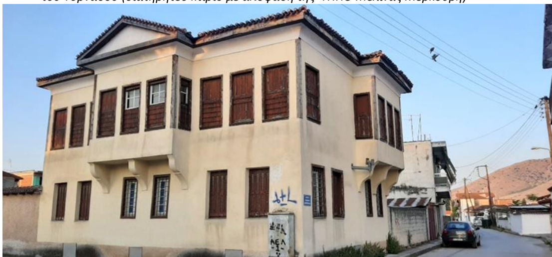
Φωτο: Διατηρητέο Κτίριο του Συλλόγου «η Ελπίς» (πρώην οικία Παπαγιάννη)