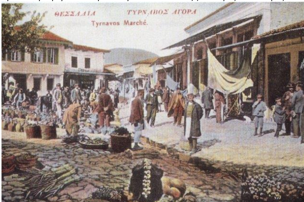
Φωτο: Η Πλατεία Αγοράς Τυρνάβου το 1916

Φωτο: Σοκάκια στον παλιό Τύρναβο. Χαρακτηριστικό το καλντερίμι και το δαιδαλώδες αυτών «...Και στ' αλήθεια! Το κάθεται, που αποτελούσε την οντότητα του Τυρνάβου στον καιρό της προσάρτησής του ήταν τέλεια νεκροφανικό...» και συνεχίζοντας αναφέρει ... «α. Και στ' αλήθεια! "Αν κατά την προσάρτηση ζούσαν στον Τύρναβο ένας-δυο μορφωμένοι, μυαλωμένοι και με κύρος ντόπιοι οδηγοί ψυχών και μυαλών, θα 'ταν πολύ εύκολο γι' αυτούς να νοιώσουν, πώς ή πατρίδα τους υστερ' άπ' το ξέκομμά της από την επαρχία τής Έλασσόνας, υστέρτα δηλαδή από το χάσιμο τόσο μεγάλης γεωργικής και κτηνοτροφικής περιοχής, πού είχαν ως τότε, και πώς άπ' τη γειτονιά της με τη Λάρισα, πολύ γρήγορα θα πάθαινε διαρροή από το κάθε προοδευτικό στοιχείο της και ολοένα, ξεπέφτοντας, θα καταντούσε σέ μεγαλοχώρι... β. Τέτοιοι ταγοί, αν βρίσκονταν τότε στην πατρίδα μου, θα μπορούσαν να προλάβουν και το φούντωμα τού κομματισμού με όλα τα θλιβερά επακόλουθά του καθώς και την έ π ι δ ρ ο μ ή πολιτευομένων προσώπων εντελώς ξένων προς τον τόπο μας...»