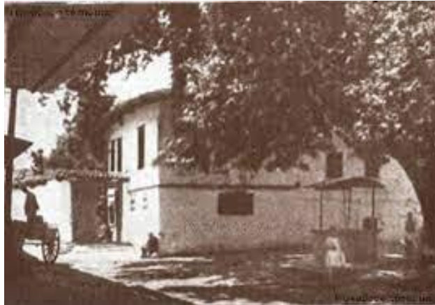
Φωτο: Σπίτι στη συνοικία «Καραβάκι» στον Τύρναβο

προέρχεται από συγκοπήν του ονόματος Τουραχαν με την κατάληξιν «οβον», ως Μέτσοβον, Κεράσοβον κλπ. ήτοι Τουραχάνοβον – Τούρναβον. Ο ίδιος ο Τουραχάν, δια να προσελκύση κατοίκους εις την αυτού κτιζομένην κωμόπολιν και εις θέσιν μέχρι τότε λεγομένην «Καλύβια», κατά τον ίδιον Κούμαν, έκτισε τέμενος εις την συνοικίαν Ρηχάν, την οποίαν ετυμολόγησαν τινές πάλιν εκ του ονόματος του Τουραχάν, καθώς και ναόν του αγίου Νικολάου, όστις, κατά μαρτυρίαν προ 70 ετών, ελέγετο άγιος Νικόλαος του Τουραχάνμπεη....».