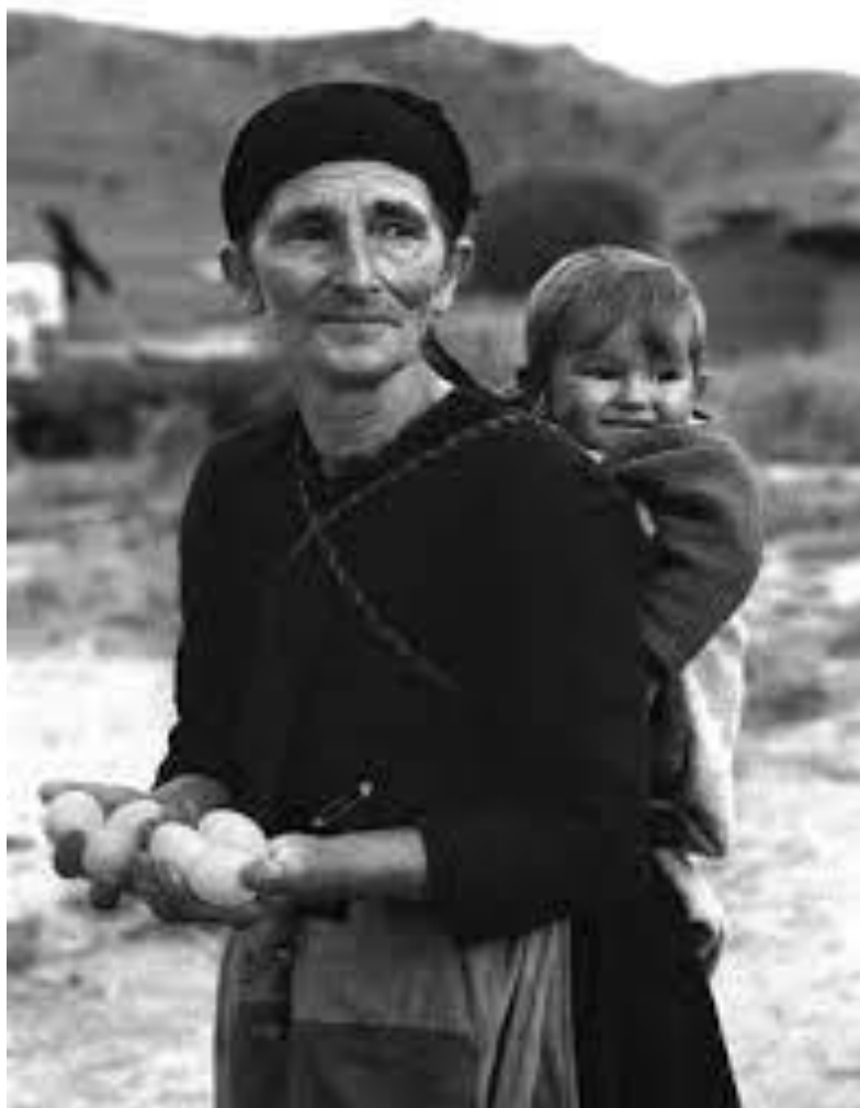
Φωτο: Η καθημερινότητα, η αγάπη, η φροντίδα, η ελπίδα, το μέλλον (Τάκης Τλούπας)