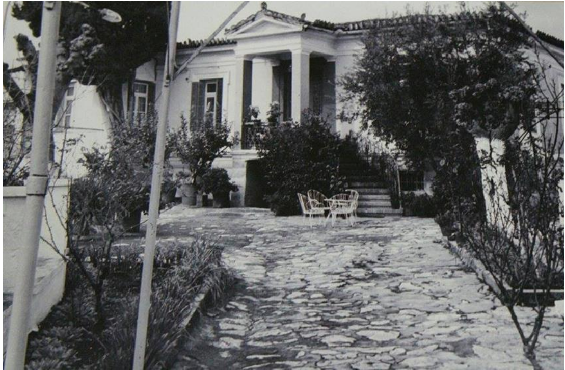
Φωτο: Αυλή με καλντερίμι σπιτιού του Τυρνάβου