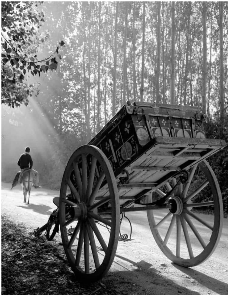
Φωτο: Στον Τύρναβο το 1964