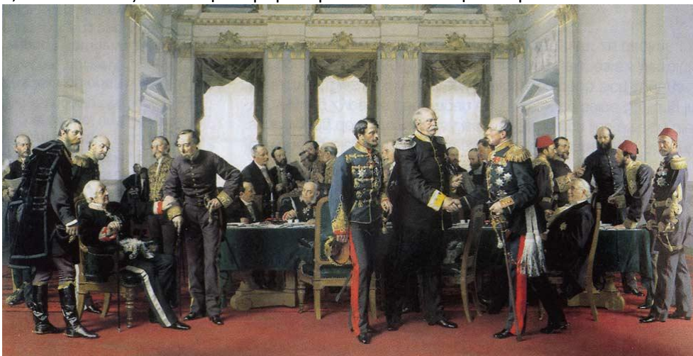
Φωτο: Απεικόνιση του Συνεδρίου του Βερολίνου

Περίπου μισό αιώνα αργότερα, μέσα σε ιδιαίτερα δύσκολες οικονομικές, κοινωνικές και στρατιωτικές περιπέτειες της μικρής μας χώρας, μέσα σ' ένα ιδιαίτερο εχθρικό ευρωπαϊκό περιβάλλον για τους Έλληνες, υπογράφεται η Βερολίνιος Συνθήκη (1878) (συνέδριο 13 ης /6-13 ης /7/1878) και σε εκτέλεση αυτής, τον Φεβρουάριο του 1881 στη Κωνσταντινούπολη υπογράφεται η ελληνοτουρκική συνθήκη «Σύμβαση περί διαρρυθμίσεως των ελληνοτουρκικών συνόρων» βάση της οποίας παραχωρούνταν στην Ελλάδα το μεγαλύτερο μέρος της Θεσσαλίας, εκτός της επαρχίας της Ελασσόνας και της περιοχής του Δαμασίου, κι ενός τμήματος της Ηπείρου. Έτσι την 1 η Σεπτεμβρίου 1881 πραγματοποιείται η ενσωμάτωση του Τυρνάβου και της ευρύτερης περιοχής του στον εθνικό κορμό, αποτελώντας πλέον την παραμεθόριο του τότε ελληνικού βασιλείου.