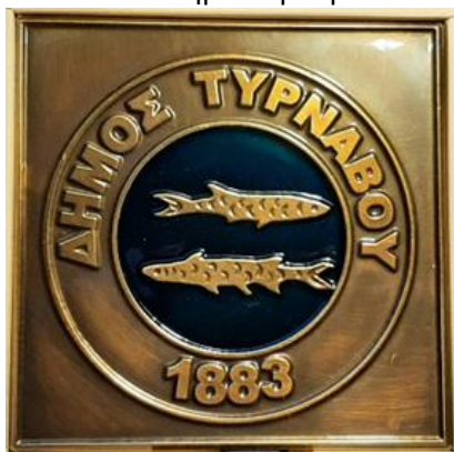
Φωτο: Δηλωτικό Σήμα του Δήμου Τυρνάβου 1883