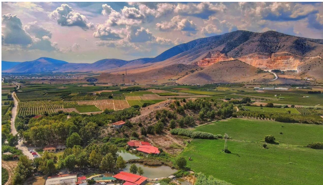
Φωτο: Πανοραμική άποψη των πηγών Αγίας Άννας (Βρύση) (Δεξιά η καταστροφή της απόληξης του Κριτηρίου από την λειτουργία λατομείων...)