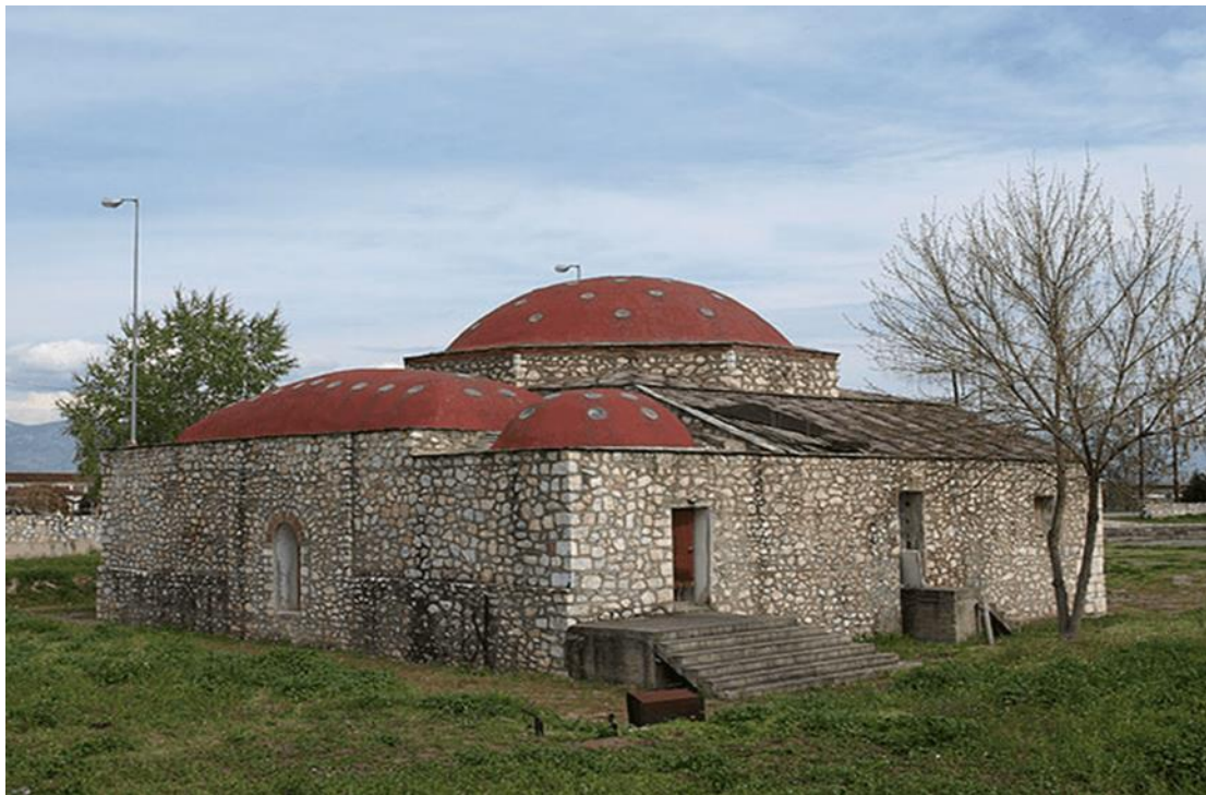
Φωτο: Τα ανακαινισμένα από τον Δήμαρχο Δημ. Κουγιώνη τουρκικά λουτρά (ΧΑΜΑΜ) στην είσοδο του Τυρνάβου (διατηρητέο κτίριο με απόφαση της ΥΠΠΟ Μελίνας Μερκούρη)