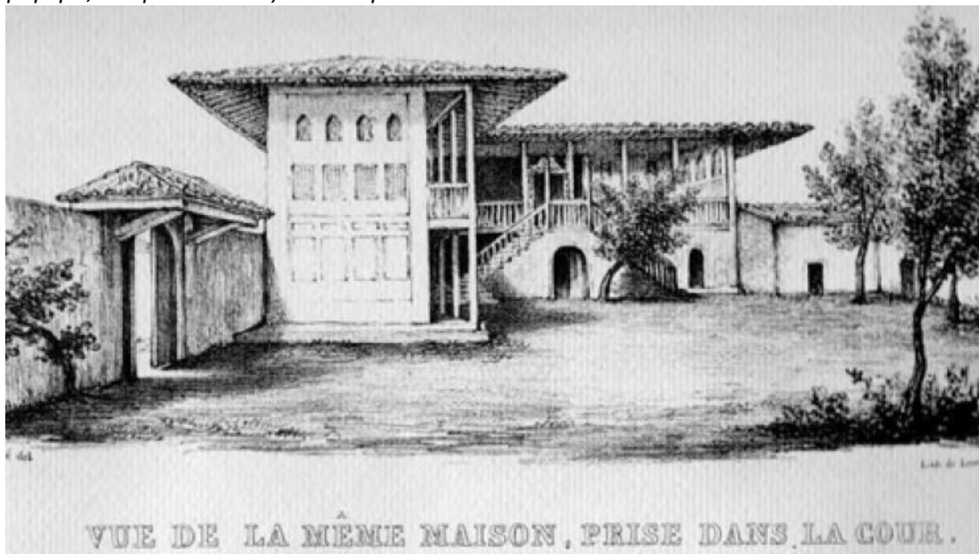
Φωτο: Απεικόνιση Σπιτιού του Τυρνάβου

Ο Νικόλαος Γεωργιάδης προέβη στην πρώτη έκδοση του βιβλίου του το 1880 σε ανάμνηση της παραμονής του στη Λάρισα κατά τα έτη 1875 – 1877. Επομένως αποκτά ιδιαίτερη αξία η γλαφυρή και πλήρης περιγραφή της θέσης και της εικόνας του Τυρνάβου, όπως και της πανέμορφης περιοχής της κοιλάδας της ποταμιάς και ιδίως του κάτω ρου του Τιταρήσιου, μέχρι το Δαμάσι, παρά την λάθος περιγραφή του χώρου της ύπαρξης των υπολειμμάτων του σαραγιού του Βελή πασά.