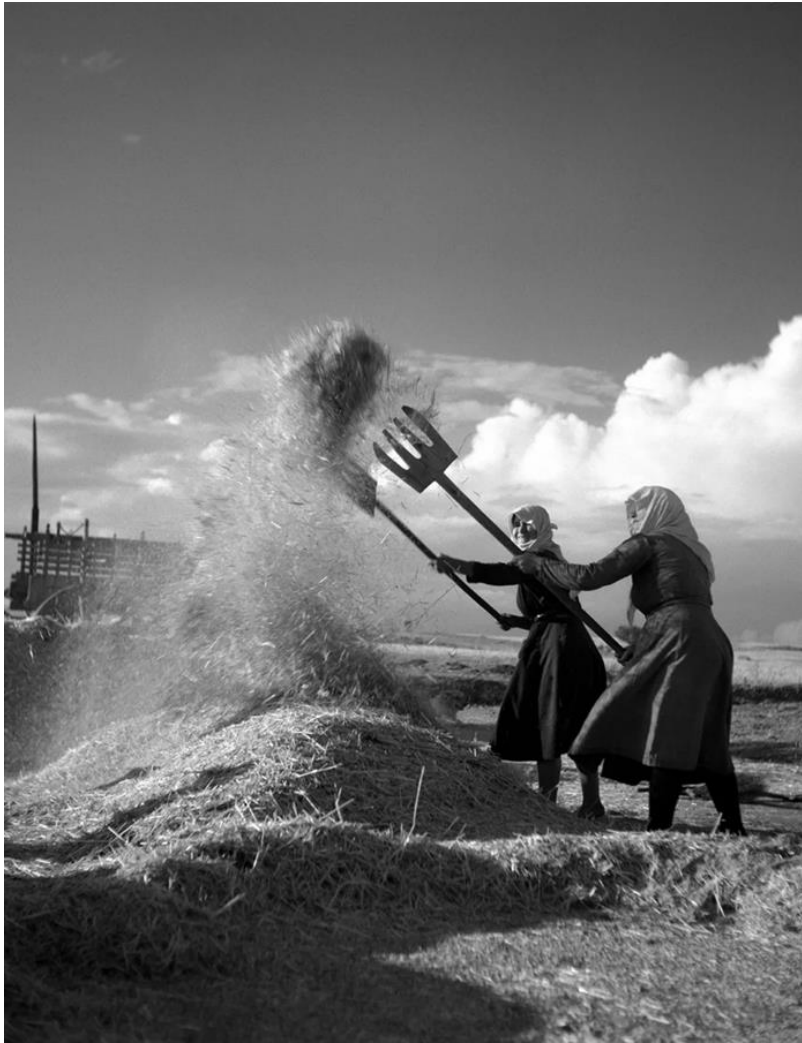
Φωτο: Λίχνισμα σιταριού