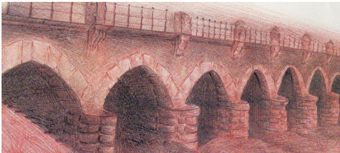
Φωτο: Σκιτσογραφία της γέφυρας του Τιταρήσιου