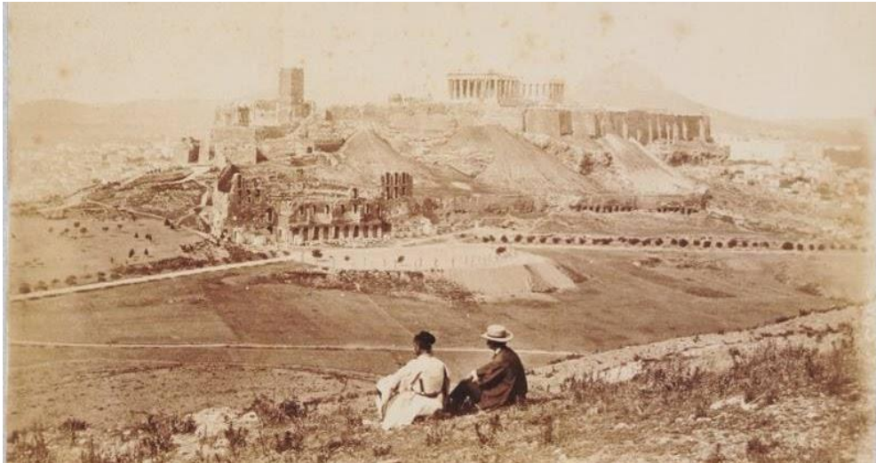
Φωτο: Η Ακρόπολη και ο Παρθενώνας, Διονυσίου Αεροπαγίτου το 1860

Το επώνυμο « Τурναβίτης » που έφερε σπουδαία οικογένεια και που οι ρίζες της ξεκινούν από την πόλη του Турνάβου από αρχές του 18 ου αι. , είναι αυτό που υπάρχει σε πολλά ιστορικά ντοκουμέντα που αφορούν την Αθήνα.