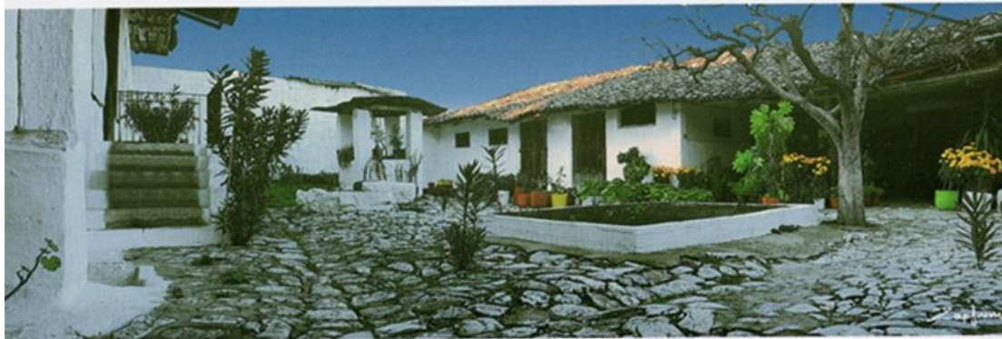
Φωτο: Αυλή σπιτιού του Τυρνάβου με καλντερίμι