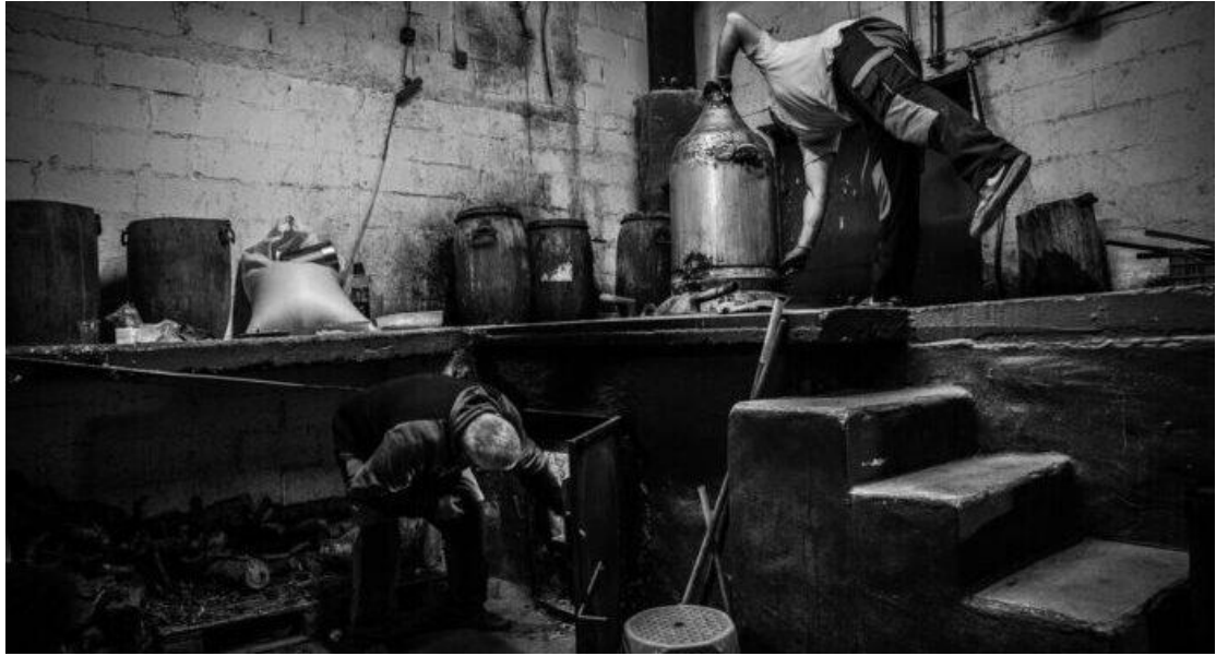
Φωτο: Παραδοσιακός Άμβυκας (Καζάνι) παραγωγής Τσίπουρου. Διαδικασία ταυτισμένη με την γη του Τυρνάβου.