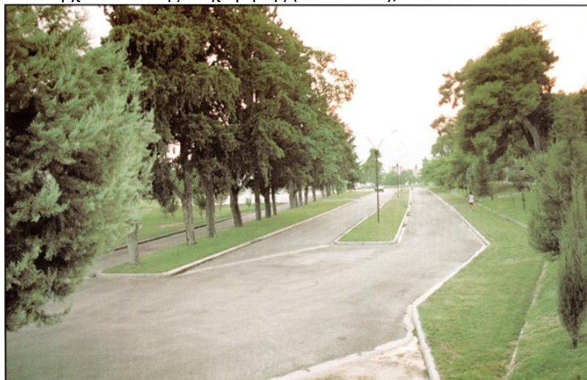
Φωτο: Διαμόρφωση χώρου Εμποροπανήγυρης Πάρκου Τούμπας