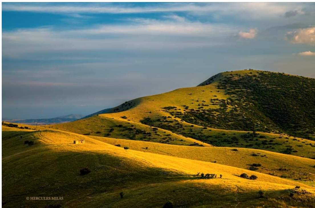
Φωτο: Πανοραμική άποψη του αυχένα του Λουσφακιού.