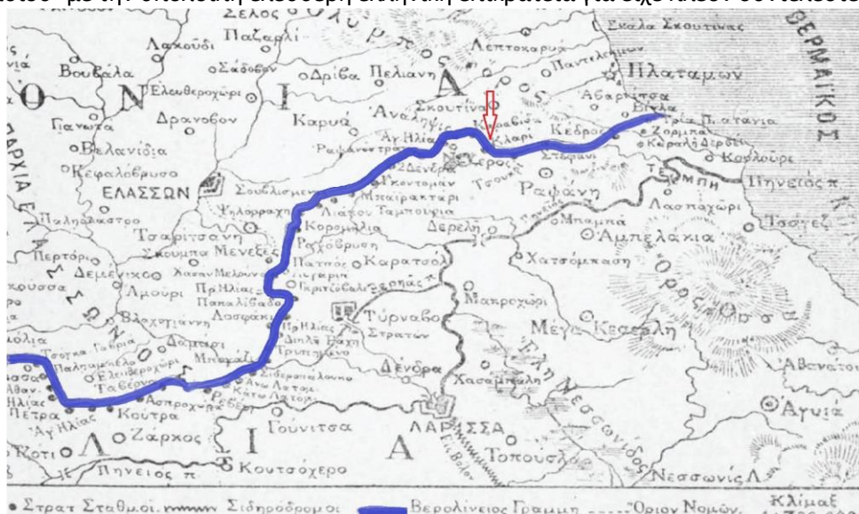
Φωτο: Χάρτης της μεθοριακής γραμμής από τον Πλαταμώνα μέχρι το Ζάρκο Τρικάλων

Ο Ελληνικός Στρατός υπό την αρχηγία του στρατηγού Σκαρλάτου Σούτσου την 31 Αυγούστου 1881 εισήλθε στη Λάρισα και την επομένη, το πρωί της 1 ης Σεπτεμβρίου 1881 , εισήλθε στον Τύρναβο απελευθερώνοντάς τον (κατά μια έννοια), καθιστώντας τον τμήμα της Ελλάδας. Με τον τρόπο αυτό η ένωση του Τυρνάβου και των χωριών του -εκτός του Δαμασίου- με την υπόλοιπη ελεύθερη ελληνική επικράτεια για είχε πλέον συντελεστεί.