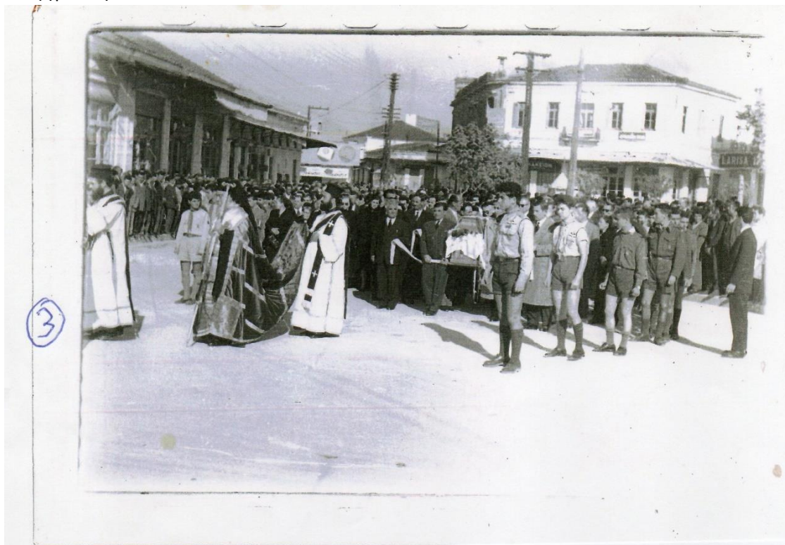
Φωτο: Κηδεία Δημάρχου Πανταζή Πλάκα

Οι συνεχείς δραστηριότητές του με τα κοινά, συνετέλεσαν ώστε να μην αποκτήσει δική του οικογένεια. Τα αδέλφια του ήταν : ο Γεώργιος, Άγγελος, Άννα, Μαρίκα Φλώρα, Κούλα και Αθηνά. Η αδελφή του Μαρίκα, ήταν σύζυγος του τέως Δημάρχου Λάρισας Χατζηγιάννη.