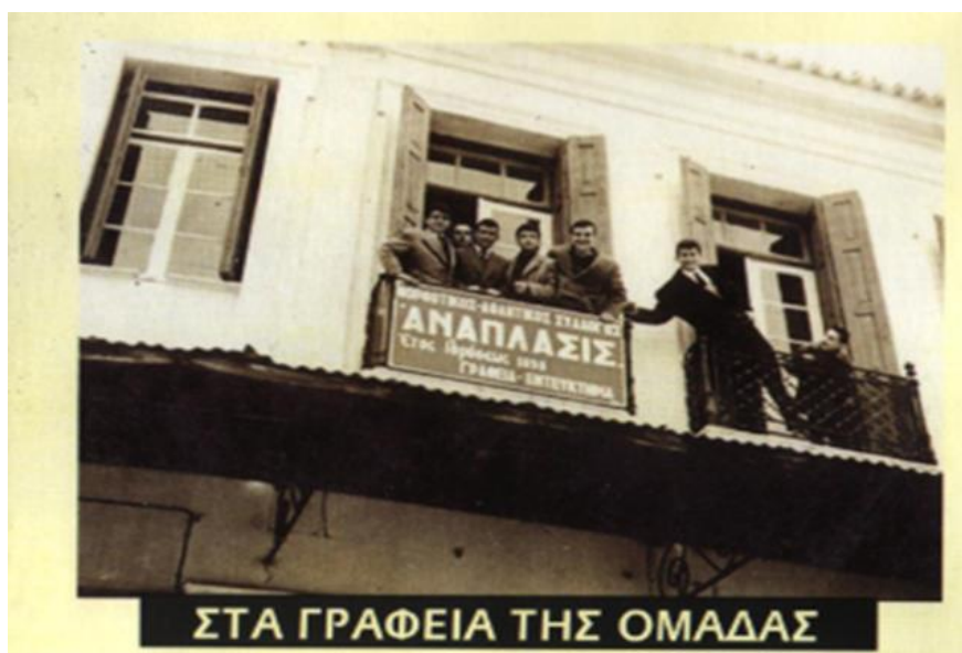
Φωτο: Ποδοσφαιριστές τις ομάδας . Τα γραφεία βρίσκονταν στον όροφο του κτιρίου που κατεδαφίστηκε στην Κεντρική Πλατεία

Η αγάπη για την Ελλάδα και την ιδιαίτερή του πατρίδα οδήγησαν τον Εμμανουήλ Αρίδα στο δρόμο της επιστροφής. Στα γνώριμα πάτρια εδάφη, αναπτύσσει επιχειρηματική δραστηριότητα ασχολούμενος με τα αυτοκίνητα και τα τότε καταστήματα οιομαγειρείων, στη Λάρισα μέχρι το 1944. Η λαίλαπα του πολέμου και η αποχώρηση των Γερμανών κατακτητών, κατέστρεψε στο πέρασμά της, ότι με κόπο και θυσίες οικοδόμησε ο Εμμανουήλ Αρίδας.