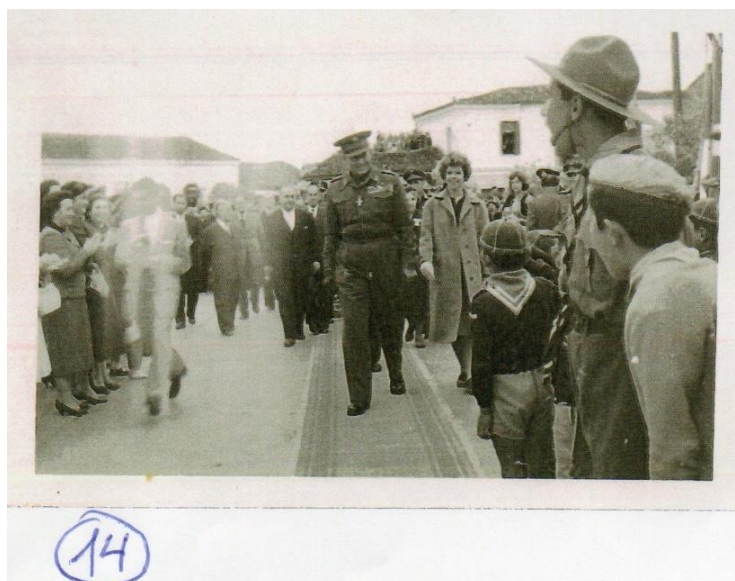
Φωτο: Βασιλεύς Παύλος - Πριγκίπισσα Ειρήνη στον Τύρναβο επί δημαρχίας Νασίκα

Το 1964, ως επιτυχών Δήμαρχος, παρασημοφορείται με το χρυσό σταυρό του Φοίνικα, από τον τότε Βασιλέα Παύλο.