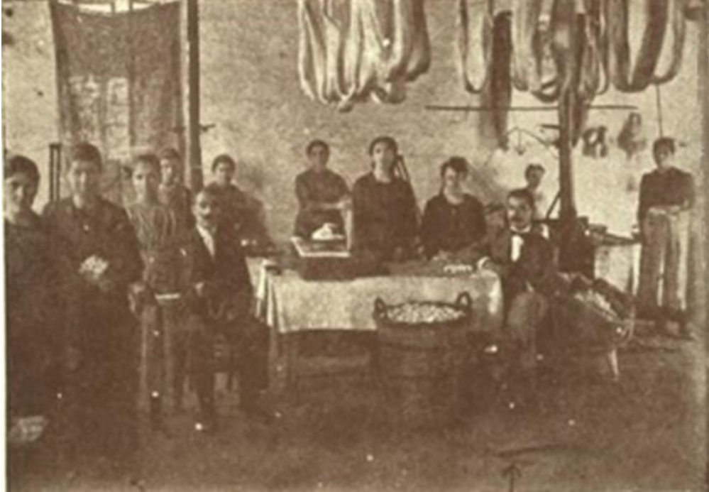
Φωτο: Μεταξοκλωστήριον Αφοι Κόντου

γνωστά στους παλιότερους βρωμόρεματα «Μπάλιακας» της αγοράς, ο «Μπάλιακας στην περιοχή «Καραβάκι» και στα «Μάρμαρα» σκεπάστηκαν και έφυγε η βρωμιά από το κέντρο της πόλης και τις συνοικίες... Ανήκα τότε στην Ένωση Κέντρου και δε δίστασα όπως και έκανα αρκετές φορές, επισκέφτηκα στο Τρίκερι τους Τυρναβίτες εξόριστους κομμουνιστές πηγαίνοντάς τους πέρα από την ανθρώπινη καλημέρα και την αγάπη μου, οικονομική βοήθεια, τσιγάρα, γλυκά και άλλα, δείχνοντας ότι ο δήμαρχος Τυρνάβου είναι δήμαρχος όλων πέρα από πολιτικές αντιπαραθέσεις.