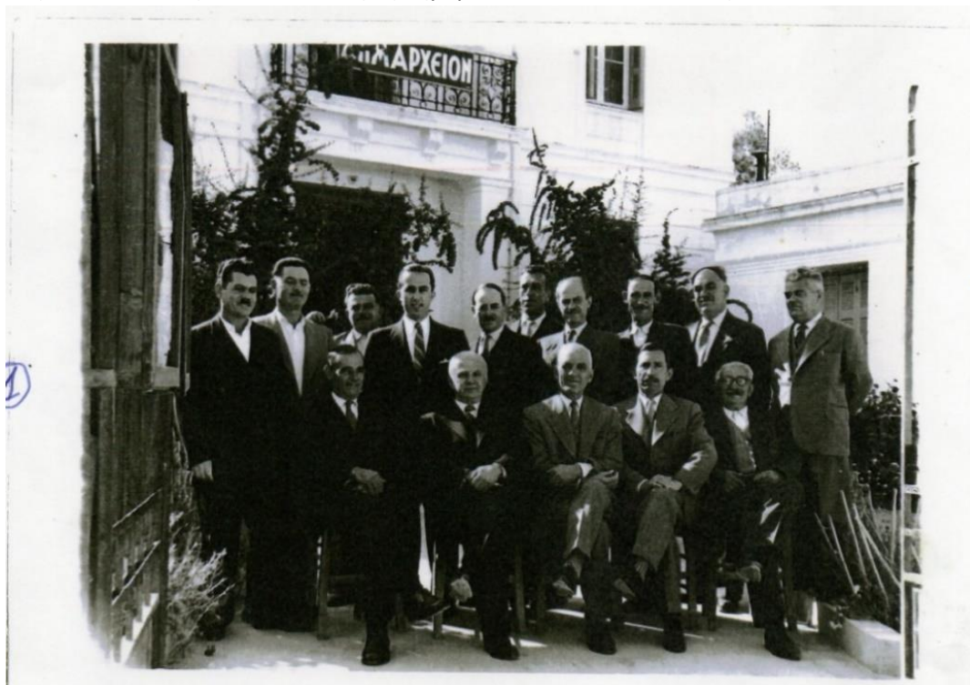
Φωτο: Δημαρχία Πλάκα (Μητσιός, Μαμανός, Πατμαλής, Αρίδας, Μουστάκας, Σταύρου, Σαρχώσης, Λουλιές, Γκόγκας, Πλάκας, Μαμανός)

Επανεκλέχθηκε ως Πρώτος Δήμαρχος του Δήμου Τυρνάβου και ανέλαβε τα καθήκοντά του στις 19-1-1955 έως την ημέρα του θανάτου του, στις 26-11-1957.