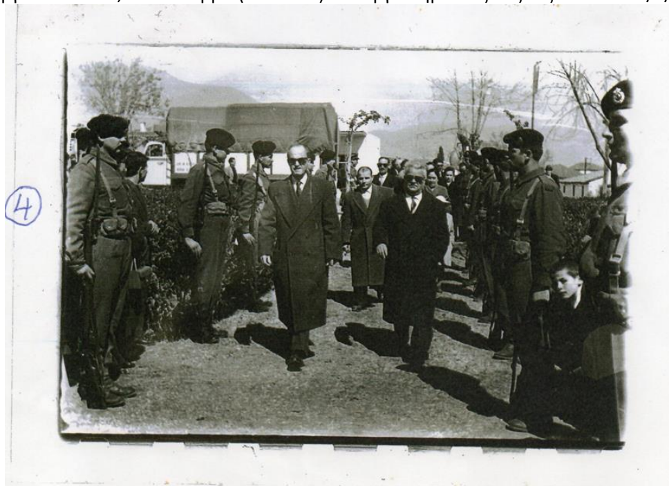
Φωτο: Κατάθεση Στεφάνων επί δημαρχίας Αρίδα

Τσαλδάρη και Σ. Βενιζέλο, τον Γ. Παπανδρέου υπουργό Εσωτερικών, τον Π. Κανελλόπουλο υπουργό Ναυτικών, τον Ν. Ζέρβα (του ΕΔΕΣ) υπουργό Δημοσίας Τάξεως κ.λπ. το 27/5/1947.