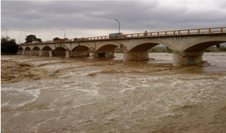
Φωτο: Ο Τιταρήσιος πλημμυρισμένος