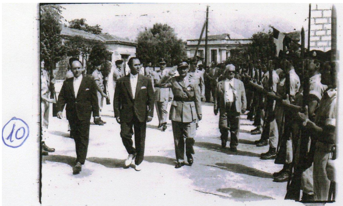
Φωτο: Εθνική Εορτή επί δημαρχίας Νασίκα