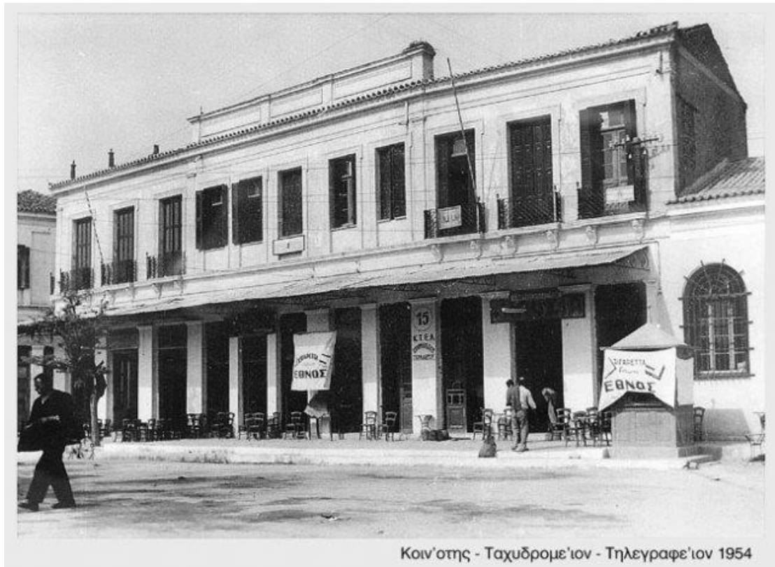
Κοιν'οτης - Ταχυδρομε'ιον - Τηλεγραφε'ιον 1954

Φωτο: Κτίριο με καταστήματα και γραφεία της οικογένειας Πλάκα στην Κ. Πλατεία Τυρνάβου