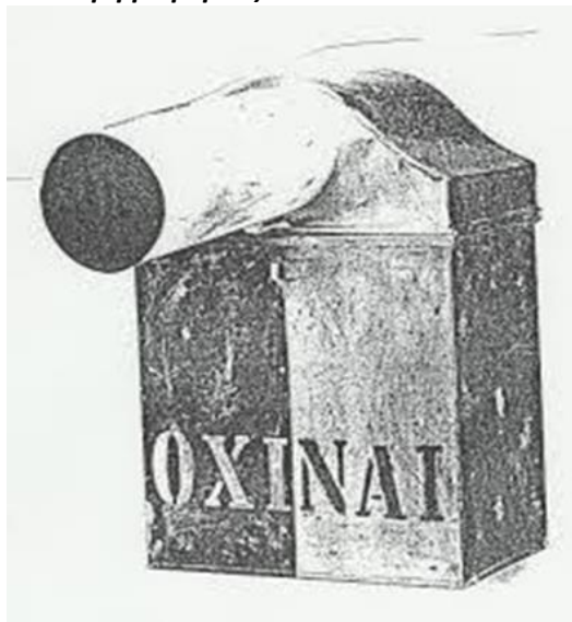
Φωτο: Κάλπη που δέχονταν άσπρα και μαύρα σφαιρίδια

1. Την περίοδο της αντιβασιλείας οι Βαυαροί επιχείρησαν την οργάνωση της τοπικής αυτοδιοίκησης σύμφωνα με τα ευρωπαϊκά πρότυπα με τον νόμο της 27 ης Δεκεμβρίου 1833 – 8 ης Ιανουαρίου 1834 «Περί Δήμων και Δημοτικών Αρχόντων» και στη θέση του ιδρύθηκαν οι δήμοι τριών τάξεων ανάλογα με τον πληθυσμό τους στο νεότευκτο Ελληνικό Κράτος. Για πρώτη μάάλιστα φορά μνημονεύεται ως θεσμός στο Σύνταγμα του 1864 όπου μεταξύ των άλλων όριζε ότι : «η εκλογή των δημοτικών αρχών θέλει γίνεσθαι δι' αμέσου, καθολικής και μυστικής δια σφαιριδίων ψηφοφορίας».