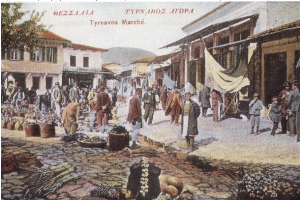
Φωτο: Η Πλατεία Αγοράς Τυρνάβου το 1916

Φωτο: Σοκάκια στον παλιό Τύρναβο. Χαρακτηριστικό το καλντερίμι και το δαιδαλώδες αυτών «...Και στ' αλήθεια! Το κάθετι, που αποτελούσε την οντότητα του Τυρνάβου στον καιρό της προσάρτησής του ήταν τέλεια νεκροφανικό...» και συνεχίζοντας αναφέρει ... «α. Και στ' αλήθεια! "Αν κατά την προσάρτηση ζούσαν στον Τύρναβο ένας-δυο μορφωμένοι, μυαλωμένοι και με κύρος ντόπιοι οδηγοί ψυχών και μυαλών, θα 'ταν πολύ εύκολο γι' αυτούς να νοιώσουν, πώς ή πατρίδα τους υστερ' άπ' το ξέκομμά της από την επαρχία τής Έλασσόνας, υστέρα δηλαδή από το χάσιμο τόσο μεγάλης γεωργικής και κτηνοτροφικής περιοχής, πού είχαν ως τότε, και πώς άπ' τη γειτονιά της με τη Λάρισα, πολύ γρήγορα θα πάθαινε διαρροή από το κάθε προοδευτικό στοιχείο της και ολοένα, ξεπέφτοντας, θα καταντούσε σέ μεγαλοχώρι... β. Τέτοιοι ταγοί, αν βρίσκονταν τότε στην πατρίδα μου, θα μπορούσαν να προλάβουν και το φούντωμα τού κομματισμού με όλα τα θλιβερά επακόλουθά του καθώς και την έπιδρομή πολιτευομένων προσώπων εντελώς ξένων προς τον τόπο μας...»